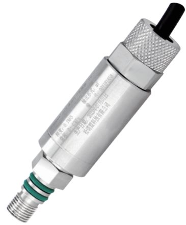
装载机秤专用压力传感器